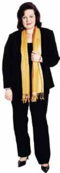
ANNE HOLMLUND sisäasiainministeri

»Rakentamisen laatuun ja asuinympäristöjen kehittämiseen on panostettava - sillä, miten ja missä asumme, on merkitystä meidän kaikkien hyvään arkeen.»