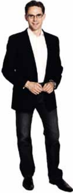
JYRKI KATAINEN valtiovarainministeri

»Nuorisotyöttömyyden ja syrjäytymisen ehkäisemiseksi tarvitsemme voimakkaampaa otetta nuorison ohjaamiseen koulutukseen ja työelämään.»