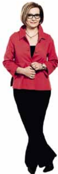
PAULA RISIKKO peruspalveluministeri