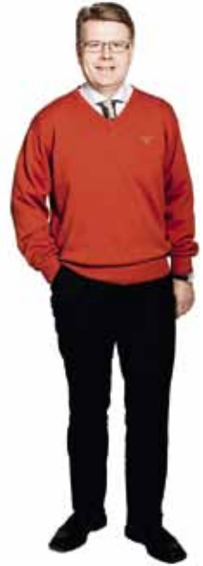
JYRI HÄKÄMIES puolustusministeri

pungeissa ja maaseudulla. Olemme vaihtaneet ajatuksia Suomen nykytilasta ja maamme tulevaisuudesta. Puolin ja toisin on kuunneltu ja kysely, oltu joistain asioista eri mieltä ja toisista samaa mieltä.