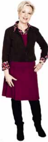
SUVI LINDÉN viestintäministeri