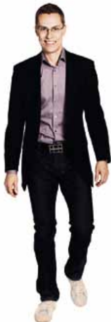
ALEXANDER STUBB ulkoasiainministeri