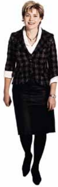
HENNA VIRKKUNEN opetusministeri